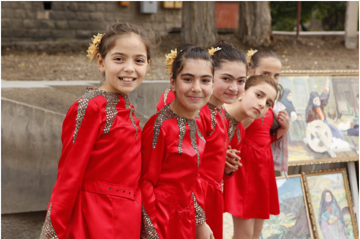
სურათზე: ადგილობრივი თემისა და მთავრობის მონაწილეობით აღდგენილი პარკი; ბავშვები პარკის გახსნის ცერემონიაზე.